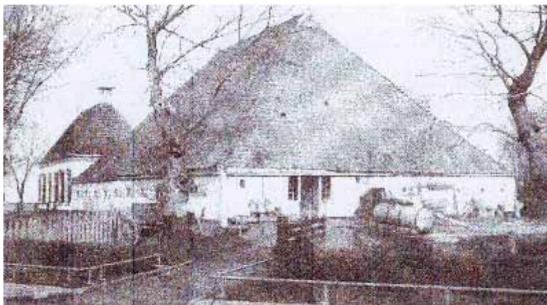
Lieuwkama te Makkum Ut: S. ten Hoeve, Lieuwkamastate (2002)

Jonge kearels komme sjongende de himmen út wei; De pols op 't skouder, foarjiers-dronken. Ik bin te âld om dronken te wurden, Mar de reade kop fan in soerstâl stek ik op 'e jas En wiid set ik de sinnen iepen. Ryk en bliid leit it lân, Griene teisters driuwe fan 'e wâl ôf de sleatten op; Ut it westen komt de fochtige wyn. Efter doarpstún en hiem bliuw ik stean. It âld stek en rou haach-guod wylde begroeid, De gloaiende wâlen sa grien! De brune sleat fol tyljende maitiidsgeur; En oprinnend nei 't hege, út modder en weaze, De hokken en stekken fan 't boere-eigen, En tsjillen en slachters; en dan it binhús Earen sa steatlik, no âld en skeamel! O dit allegear' mei ien streek te omfiemjen, – As hy dy't ik net neame sil! – En by it bargehok stean ik as in muorre.