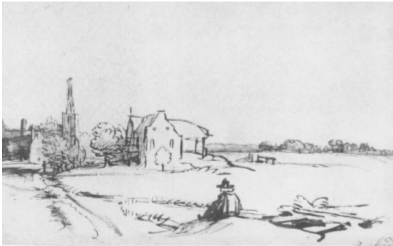
Rembrandt, Gesicht op Diemen mei in (de?) tekener Ut: B. Bakker e.a., Het landschap van Rembrandt (1998)

mei it gedicht Juster is der in belangrike oerienkomst. Lykas dêre hâldt him hjir de fraach dwaande oft eat wol bewarre bliuwt (sa't er sels sa faak seit).